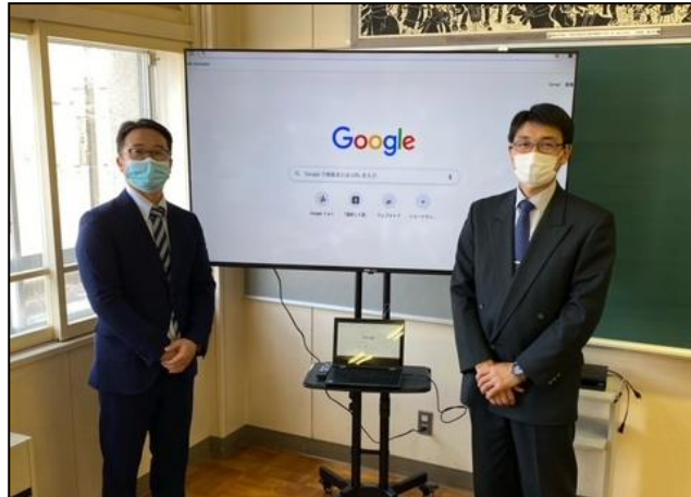
青森市立筒井南小学校 教室内