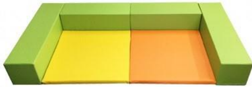
〈キッズコーナーベージュ〉