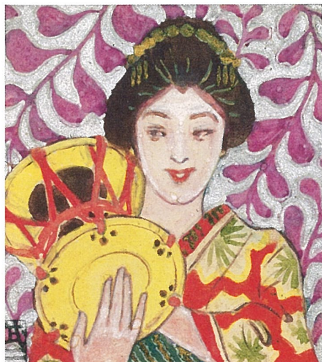
藤島武二《音楽六題(鼓)》1901-06年 水彩、紙