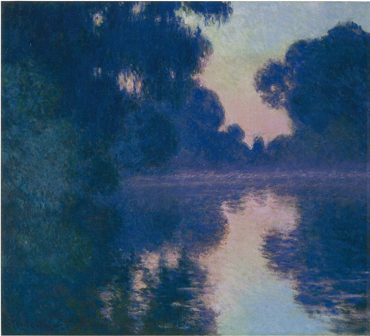
クロード・モネ《セーヌ河の朝》1897年 油彩、カンヴァス