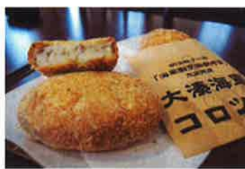
大湊海軍コロツケ 安渡館カフェ icoi-