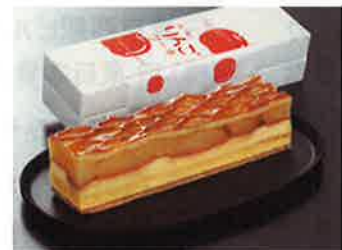
りんごケーキ お菓子のはろや(株)