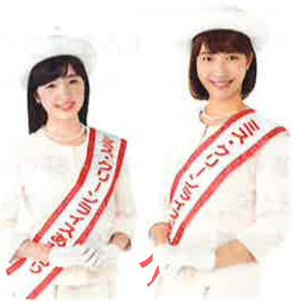
「ミス・クリーンライスあおもり」