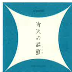
青森米「青天の霹靂」 (株) JR 東日本青森商業開発