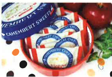
カマンベールのお菓子 From AOMORI 御菓子のみやきん