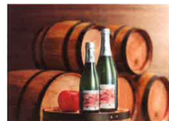
AOMORI CIDRE (株) JR 東日本青森商業開発