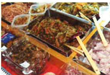
松前漬け等珍味量り売り (株) 渡辺商店