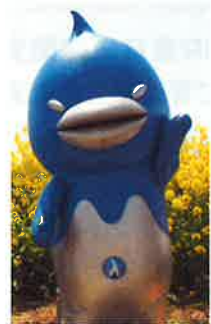
※ λ (ラムダ) プロジェクト シンボルキャラクター「マギユロウ」