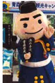
青森県産品 PR キャラクター 「決め手くん」