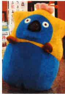
青森県・函館観光 マスコットキャラクター 「いくべえ」®