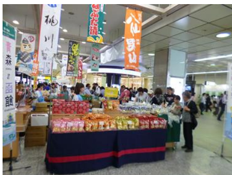
H28.6 大宮駅「青森県・函館産直市」の様子