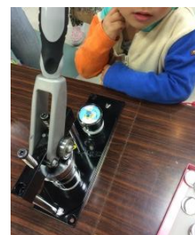
缶バッチ製作体験