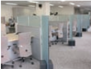
中核店（八戸営業部）

平成21年11月、各地区の中核となる営業店10ヵ店において、従来の「融資部門」を「法人営業課」、「融資課」の2課体制に発展的に分離し、「法人営業課」を法人のお客さま対応の専門部署とするなど、営業体制の大幅な改革を実施しております。