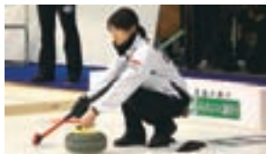
バンクーバーオリンピック カーリング日本代表決定戦