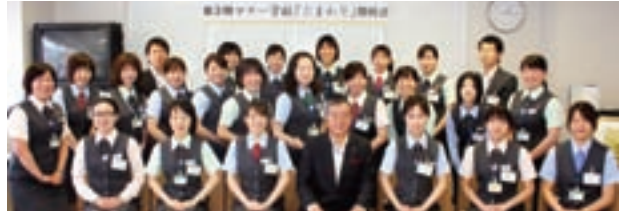
マナー研修「ひまわり」

お客さまへのサービス向上の基本となるビジネスマナーアップを目的に、マナー研修「ひまわり」を実施し、マナーアップリーダーの育成を行っております。