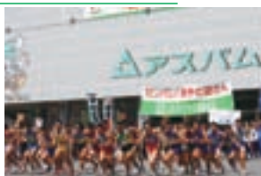
青森県民駅伝競走大会