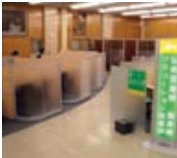
弘前ソリューション営業部

4拠点の「ソリューション営業部」は、事業性資金に関する各種コンサルティングによるソリューション提供を通じて、中堅・中小企業支援に積極的に取り組んでおります。