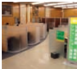
弘前ソリューション営業部

4拠点の「ソリューション営業部」は、事業性資金に関する各種コンサルティングによるソリューション提供を通じて、中堅・中小企業支援に積極的に取り組んでおります。