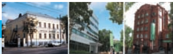
みちのく銀行（モスクワ）モスクワ本店 みちのく銀行（モスクワ）ユジノサハリンスク支店 みちのく銀行（モスクワ）ハバロフスク支店